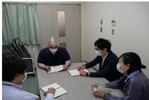
設置個所の検討と導入方法の効率化 について