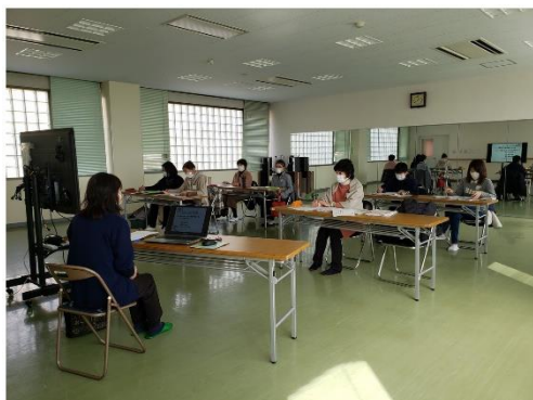
新型コロナウイルス感染症について の知識と対策予防のポイント