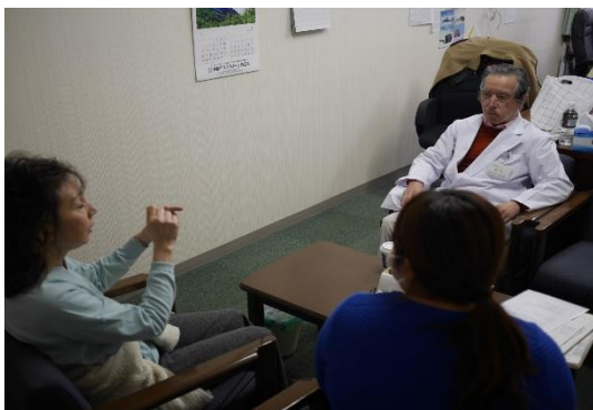
機器選定決定会議